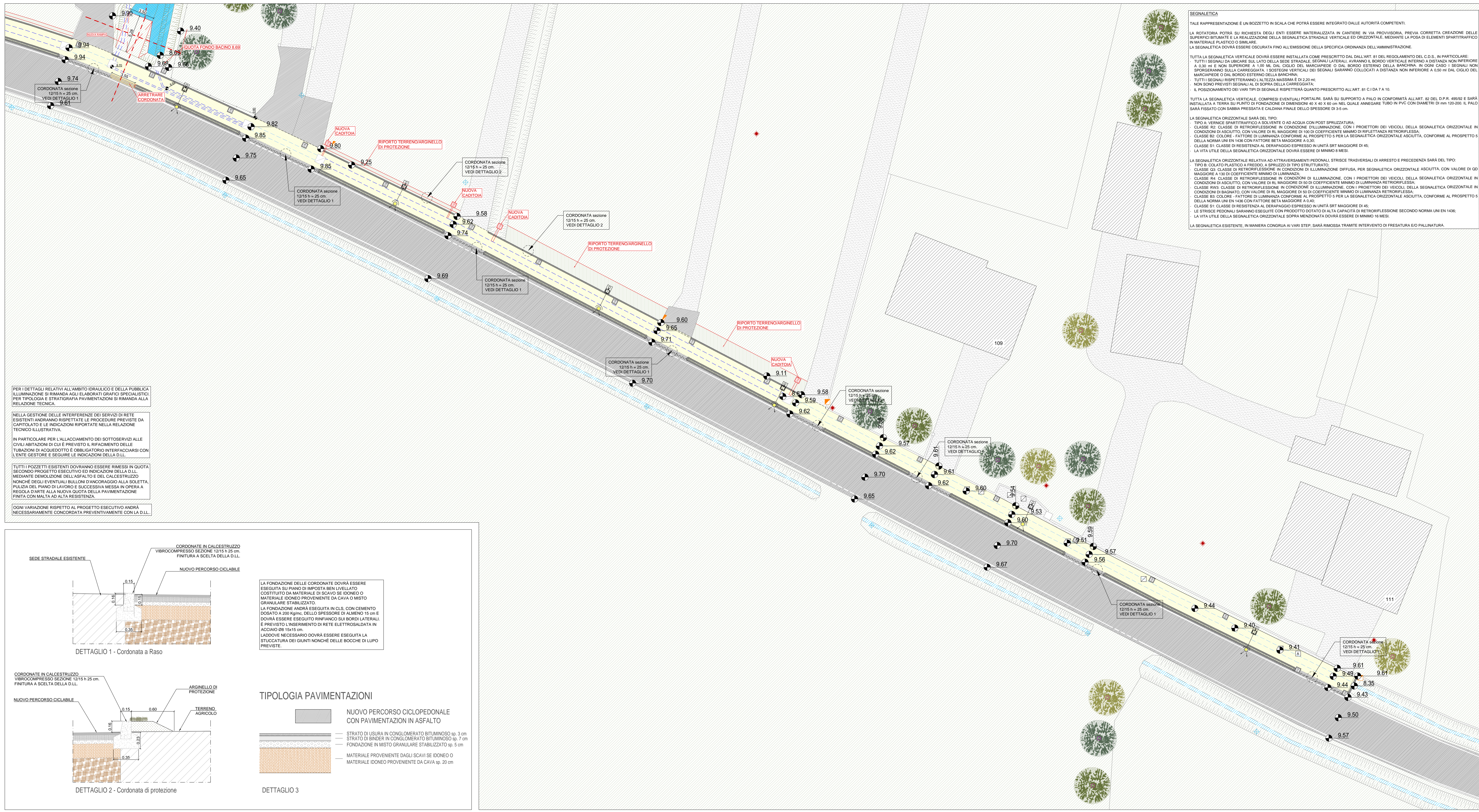
Particolare 1, 2 e 3 - Isola di separazione e tipologia pavimentazione di progetto - scala: 1:20

Il presente disegno è di nostra proprietà e non può essere riprodotto né consegnato a terzi senza nostra autorizzazione.